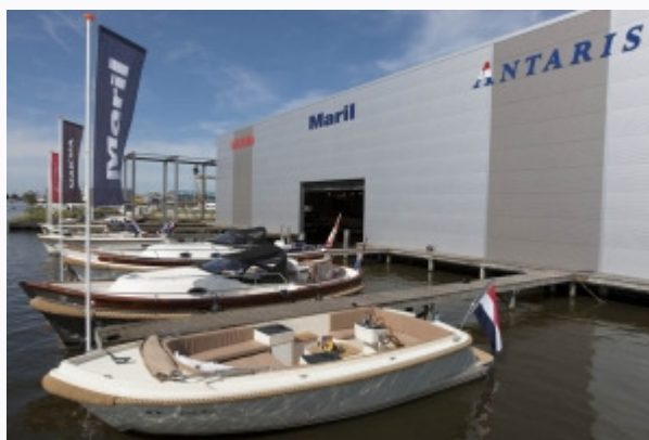
De Zwaan 28, 8551 RK Woudsend 0514 596 270 Maril, Antaris en Makma sloepen

Nodigt ons van harte uit voor een bezoek aan deze grootse watershowroom waar drie merken van sloepen worden gebouwd en tentoongesteld. Maar eerst een versnapering,... en een vermaning, in de voormalige doopsgezinde kerk "tPonkje" in het hart van Woudsend