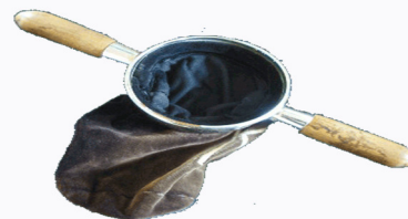
Een "Ponkje", collectezak voor doopsgezinden