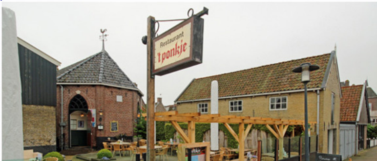
Fermaningsteech 1, 8551 SP Woudsend tel.: 0514 - 59 12 50